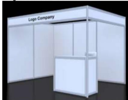
Imagen referencial del counter:

Cada stand debe incluir: un (01) counter de atención con almacén (con llave) incluir vinil impreso a full color y una (01) silla tipo stand, una (01) mesa redonda con tablero de vidrio (diámetro 50cm aprox) y dos (02) sillas modelo Frank (foto referencial). Iluminación en stand y punto de corriente.