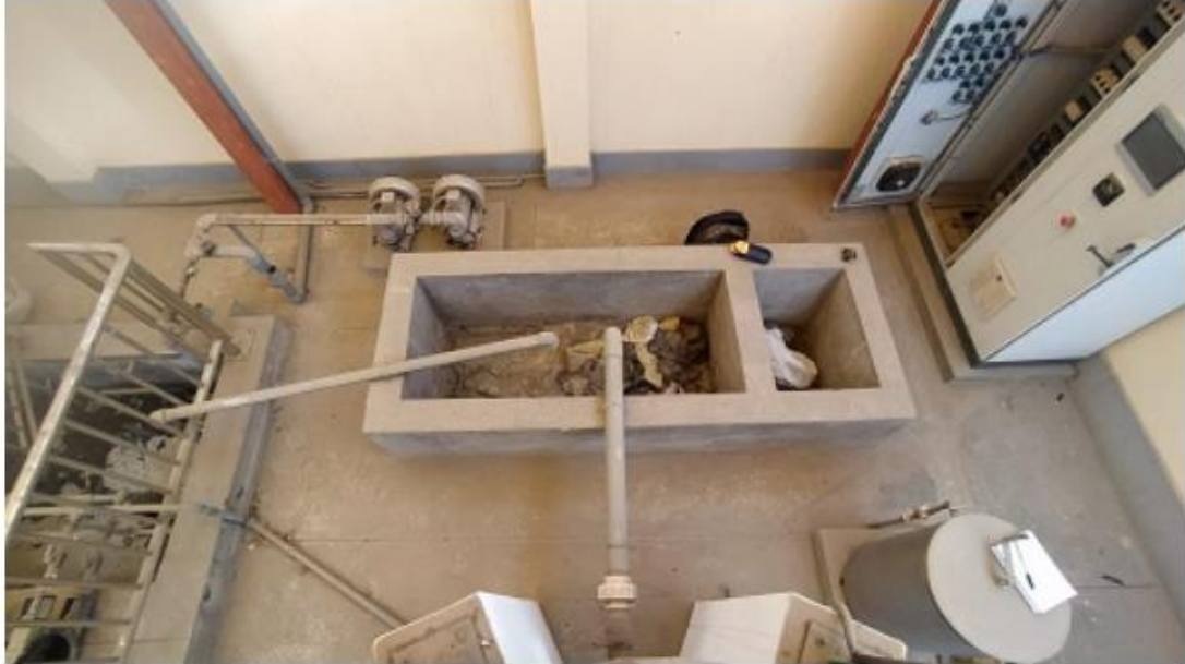
Fig. 6: Poza de lodos

"Decenio de la Igualdad de Oportunidades para Mujeres y Hombres" "Año de la Unidad, la Paz y el Desarrollo"