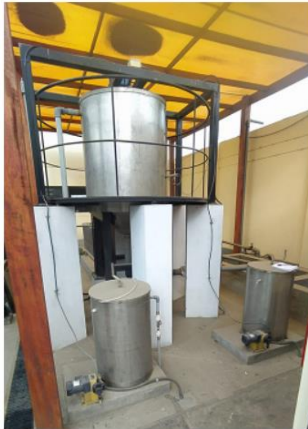
Fig. 2: Tanque de procesamiento principal de la PTAR

"Decenio de la Igualdad de Oportunidades para Mujeres y Hombres" "Año de la Unidad, la Paz y el Desarrollo"