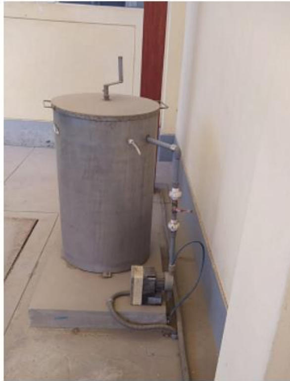
Fig. 3: Tanque de preparación de insumo químico

"Decenio de la Igualdad de Oportunidades para Mujeres y Hombres" "Año de la Unidad, la Paz y el Desarrollo"