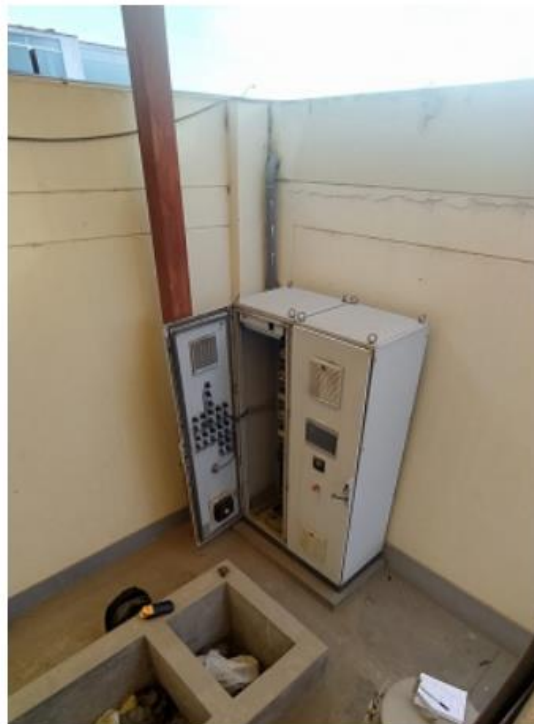
Fig. 7: Tablero eléctrico de la PTAR. No cuenta con techo de protección, está propenso a lluvias.