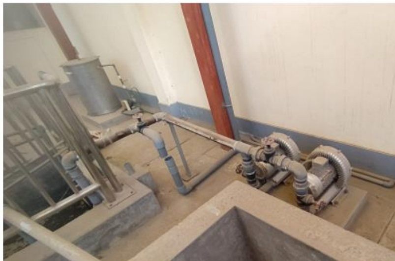
Fig. 5: Sopladores y conexión con poza de agua residual