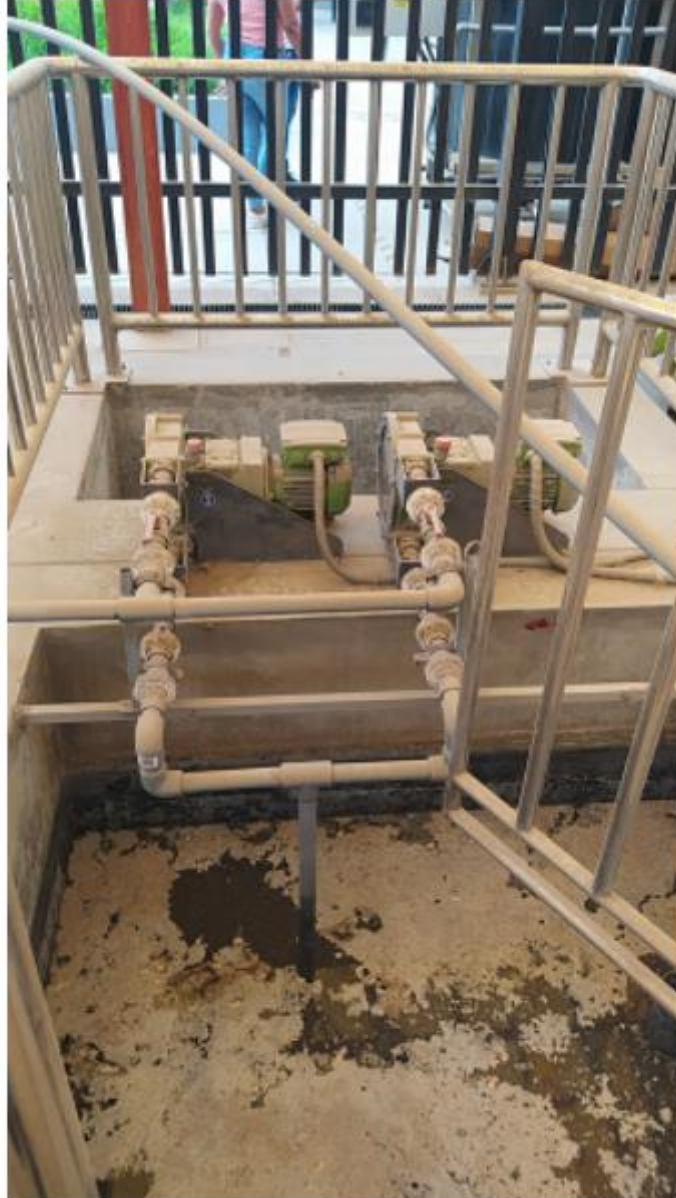
Fig. 1: Poza principal de agua residual y bombas peristálticas