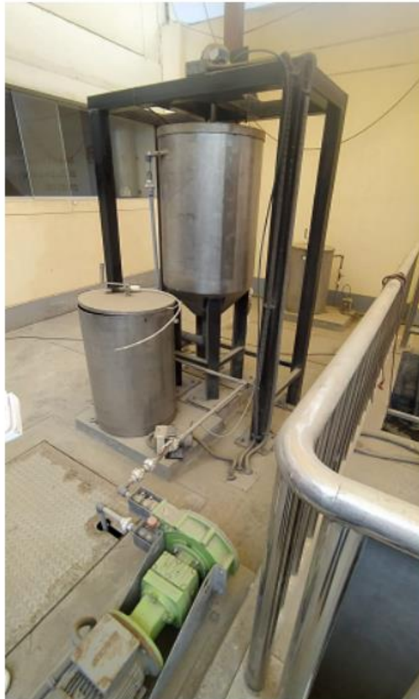
Fig. 4: Tanque de preparación de insumo químico con bomba peristáltica

"Decenio de la Igualdad de Oportunidades para Mujeres y Hombres" "Año de la Unidad, la Paz y el Desarrollo"