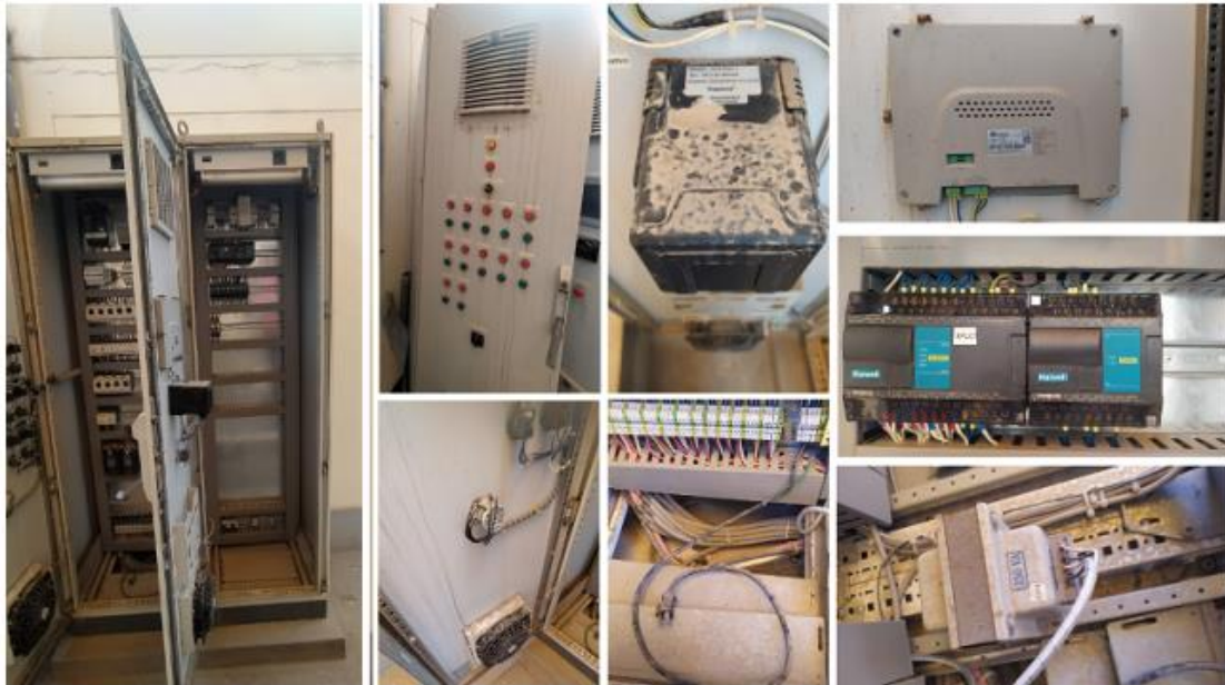
Fig. 8: Estado de componentes externos e internos del tablero eléctrico. Se observa acumulación gruesa de polvo externo e interno. Posible presencia de humedad en circuitos internos de equipos.