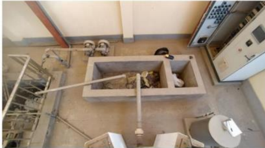
Fig. 6: Poza de lodos

"Decenio de la Igualdad de Oportunidades para Mujeres y Hombres" "Año de la Unidad, la Paz y el Desarrollo"