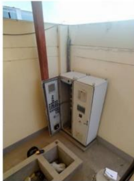
Fig. 7: Tablero eléctrico de la PTAR. No cuenta con techo de protección, está propenso a lluvias.