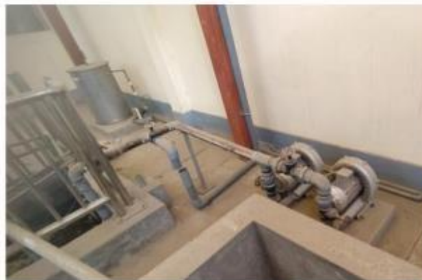
Fig. 5: Sopladores y conexión con poza de agua residual

CITEccal Trujillo Mz. N2 Lt. 1, Barrio 5A, Alto Trujillo t. (044) 728 391 www.gob.pe/itp