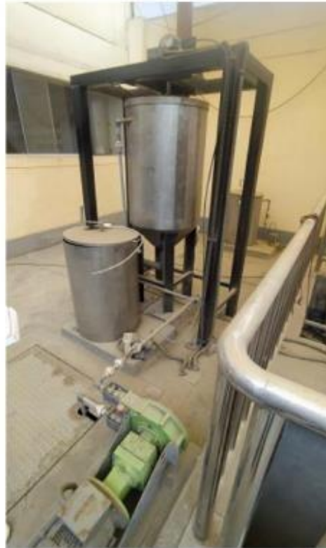
Fig. 4: Tanque de preparación de insumo químico con bomba peristáltica

"Decenio de la Igualdad de Oportunidades para Mujeres y Hombres" "Año de la Unidad, la Paz y el Desarrollo"