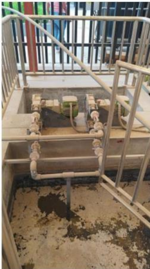
Fig. 1: Poza principal de agua residual y bombas peristálticas