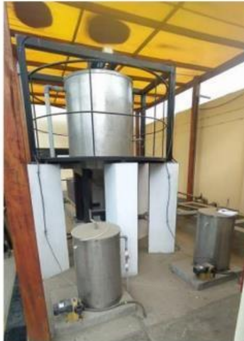
Fig. 2: Tanque de procesamiento principal de la PTAR

"Decenio de la Igualdad de Oportunidades para Mujeres y Hombres" "Año de la Unidad, la Paz y el Desarrollo"