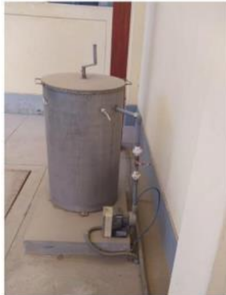
Fig. 3: Tanque de preparación de insumo químico

"Decenio de la Igualdad de Oportunidades para Mujeres y Hombres" "Año de la Unidad, la Paz y el Desarrollo"