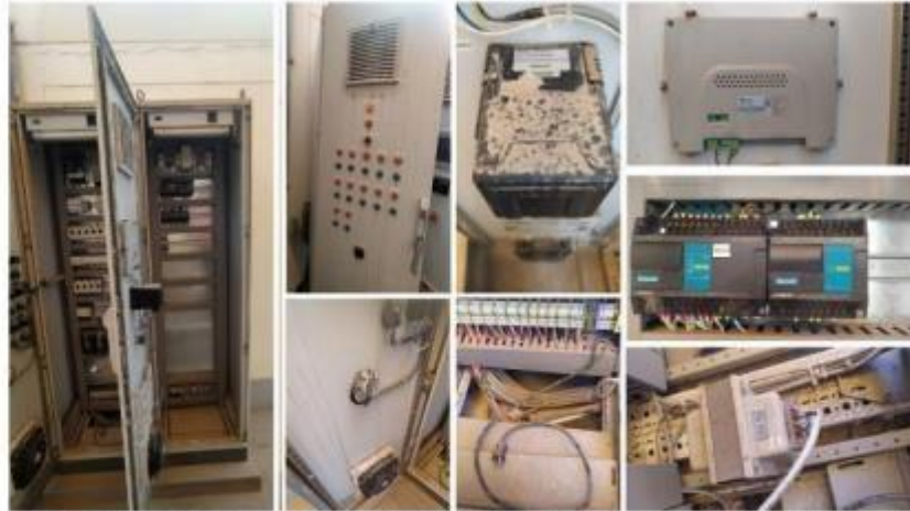
Fig. 8: Estado de componentes externos e internos del tablero eléctrico. Se observa acumulación gruesa de polvo externo e interno. Posible presencia de humedad en circuitos internos de equipos.

"Decenio de la Igualdad de Oportunidades para Mujeres y Hombres" "Año de la Unidad, la Paz y el Desarrollo"