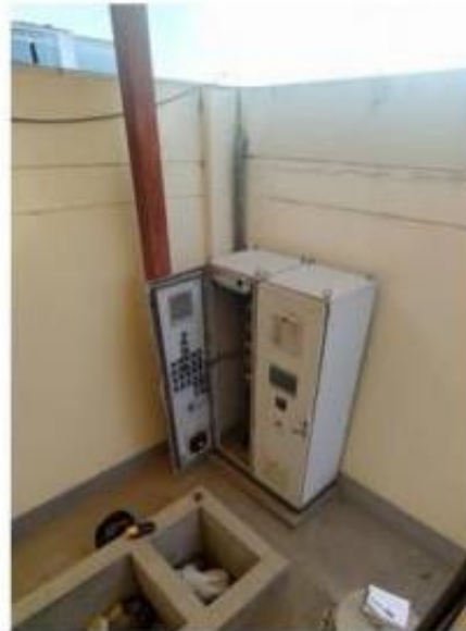
Fig. 7: Tablero eléctrico de la PTAR. No cuenta con techo de protección, está propenso a lluvias.