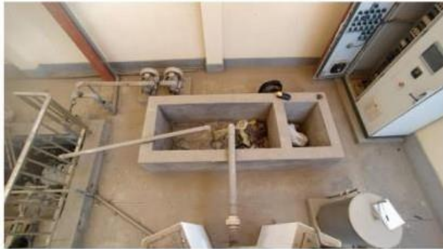
Fig. 6: Poza de lodos

"Decenio de la Igualdad de Oportunidades para Mujeres y Hombres" "Año de la Unidad, la Paz y el Desarrollo"