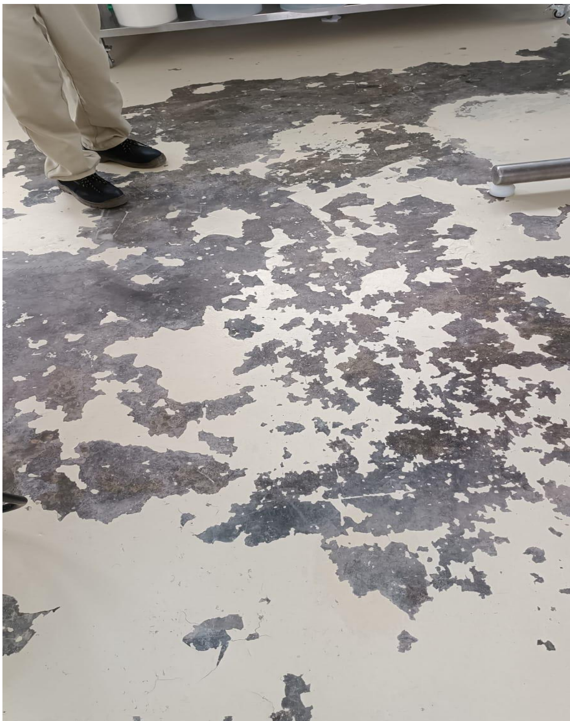
IMAGEN PARA EL SERVICIO DEL PINTADO DEL PISO