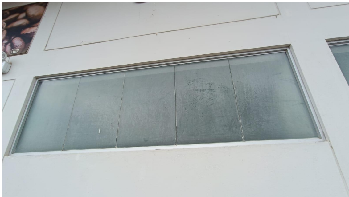
IMAGEN PARA EL SERVICIO DEL MANTENIMIENTO DEL PINTADO DE LA PARED

IMAGEN PARA EL SERVICIO DE LA INSTALACION DEL VINOLO ADHESIVO